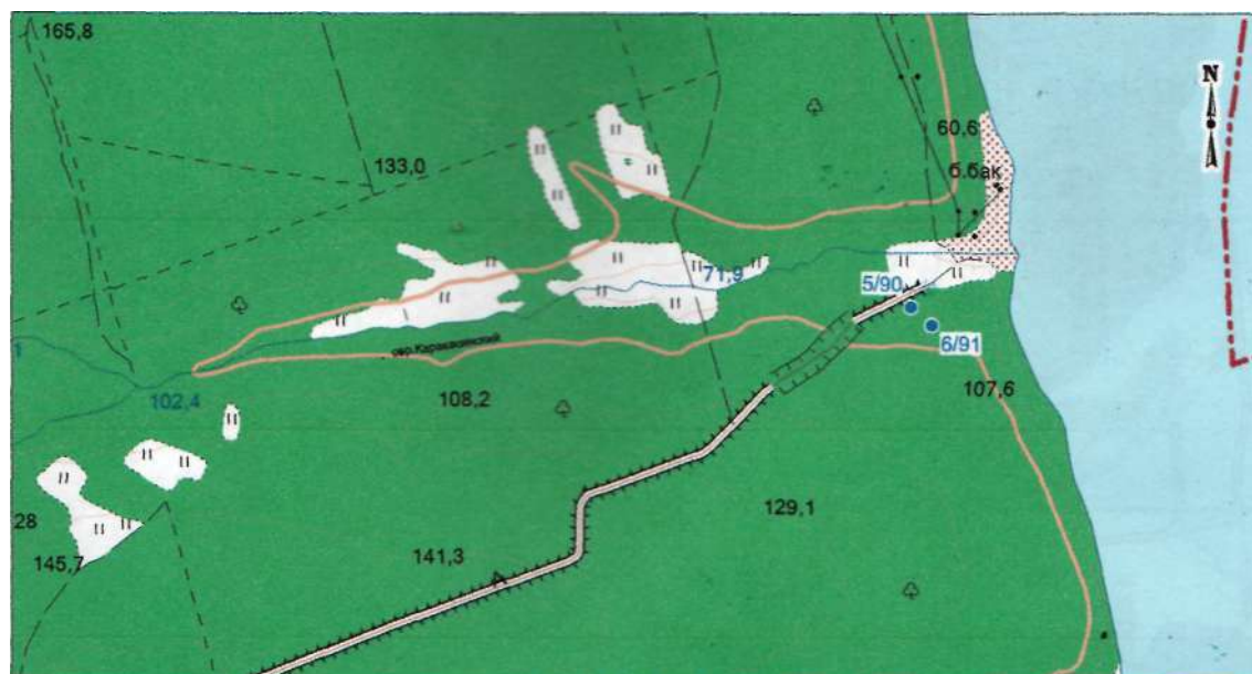
Схема расположения Кушниковского месторождения подземных вод